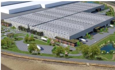
L'entrepôt de classe A au cœur du parc de l'A5 situé à Réau (77)

Clarion Partners Europe , gestionnaire de fonds d'investissement immobilier spécialisé dans les actifs logistiques et industriels, a conclu un prêt de développement senior de 30 M€ et une ligne de crédit de TVA d'environ 8 M€ auprès de la Caisse d'épargne Île-de-France (Groupe BPCE) et d' AEW , gestionnaire d'investissement mondial, pour financer la construction d'un entrepôt de classe A au cœur du parc de l'A5 situé à Réau (77), à 40 kilomètres au sud-est de Paris. Clarion Partners Europe a acquis le site en