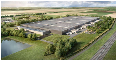
Projet de plate-forme logistique situé dans la ZAC des Bornes du Temps II, à Amiens Saint-Sauveur.

Comme annoncé par Business Immo le 13 septembre 2021, InfraRed Capital Partners a acquis, en Vefa et en blanc, un projet de plate-forme logistique XXL situé dans la ZAC des Bornes du Temps II, à Amiens Saint-Sauveur, en bordure de l'autoroute A16. Entre-temps, l'activité européenne de gestion d'investissements immobiliers d'InfraRed Capital Partners a été rachetée par Ara Europe, un investisseur immobilier d'Asie-Pacifique.