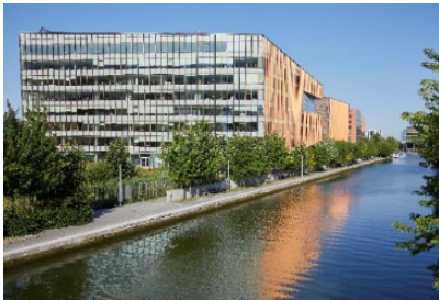
Le Millénaire 4

À la suite de la promesse synallagmatique de vente signée avec Générale Continentale Investissement (GCI) et BlackRock Real Assets le 21 décembre 2021, Icade a finalisé le 1er avril 2022 la cession de l'immeuble Le Millénaire 4 au sein du parc du Millénaire à Paris pour 186 M€.